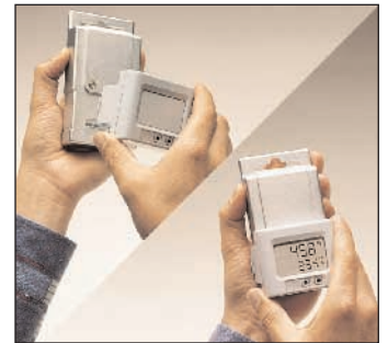
可拆装显示器, 可就地观察测量数据

通过一可拆装接口, 数据可传送至您的电脑。可拆装的显示器方便您就地观察测量数据。