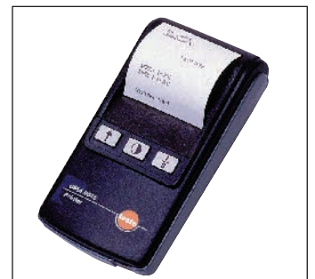
通过红外打印机分析数据