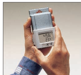
可拆装: 显示器、带打印功能的显示器, 带报警功能的显示器