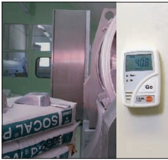
记录环境空气的温湿度, 超过限值时立即显示, 应用于生产或储存等过程中

testo175-H2电子温湿度记录仪, 带显示, 可快速查看当前读数, 并储存历史读数、最大和最小值以及超过限值的次数。