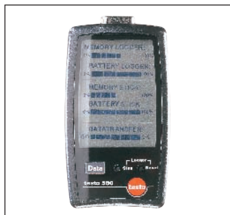
testo 580 数据采集器