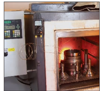
在高温环境中快速测量

该电子温度记录仪,可实现快速记录功能,例如记录工业过程中的温度波动。记录仪可配表面、浸入式空气温度探头,使其适应各种测量任务。