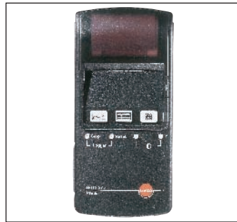
testo 575 快速打印机, 包括1卷热敏打印纸以及电池